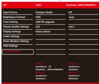
Abbildung 2-7 weitere Einstellungen