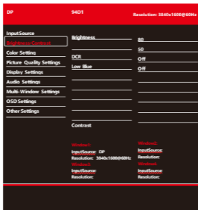
Abbildung 2-1 Brightness/Contrast Einstellungen