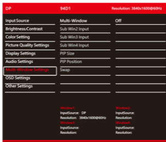
Abbildung 2-5 Dispayeinstellungen