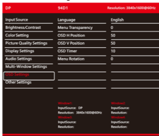
Abbildung 2-6 OSD-Einstellungen